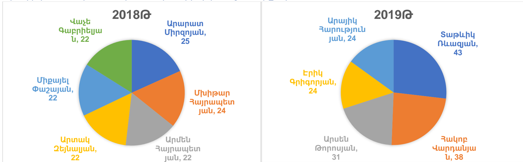
Գրաֆիկ 2. 2018թ և 2019թ 10 ամիսների գործուղումները /օր/